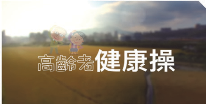
高齡者健康操 觀看次數：631,986 2,092 讚 319 學 分享 更多 衛生福利部國民健康署 發佈日期：2017年1月19日 訂閱 (5,862)

經由國民健康署網站首頁至健康學習資源進入影音專區中的 Youtube 專區可查詢到「高齡者健康操」